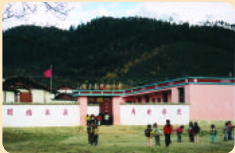
香格里拉一所小學放學的情景。

由麗江出發前往香格里拉探險，沿途風光的第一站是「長江第一彎」。此處為長江的上游金沙江，金沙江水流由青藏高原發源，往南向流；穿越迪慶自治州奔騰而下，在麗江納西族自治縣交接處的石鼓