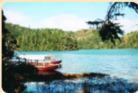
歷經長途跋涉始能欣賞到山清水秀的「碧塔湖」。

除此，香格里拉高原上有湖泊，供一些北方候鳥來此過冬，如黑頸鶴、斑頭雁；在湖泊水中任意飛翔或覓食，凸顯香格里拉生氣蓬勃的自然生態。至於遠處高山頂，春雪尚未溶