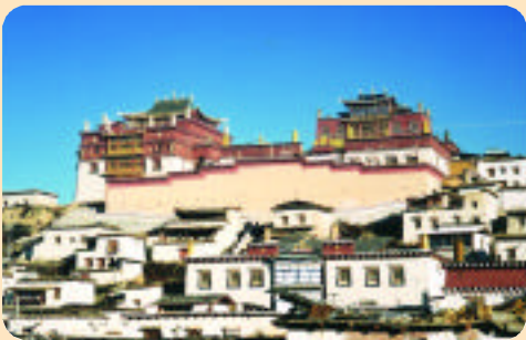
「松贊林寺」是雲南最具規模的藏傳佛教寺廟。