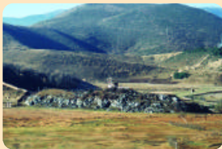
山前隆起的小丘是藏民舉行「天藏」之處。

因為，深秋季節的香格里拉，是景色最暗淡的時期；當地導遊解說，香格里拉最美麗的季节，是每年的春天（四月至六月），大地草原是綠油油的一片，花開漫山遍野，有怒放的杜鵑花、有純潔高貴的鬱金香、有潔白如玉的雪蓮花、全緣葉綠絨蒿、黃花杓蘭花及各種高山花卉，百花盛開，燦若朝霞。 春天的香格里拉，樹木林海，呈現蒼翠景象，有松柏、紅豆杉、鐵杉、珙桐等高山植物；在如此蒼翠的山林中漫步，享受大自然的