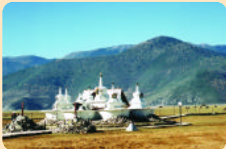
藏民居住的社區皆供奉「白塔」祈福。

結束松贊林寺的行程，前往碧塔海風景區，此為海拔三千七百公尺的高山湖泊，由香格里拉市東行三十五公里，因山路顛簸，且路面進行修築工程，部份路段需繞道而行，來回車程超過四個小時；其實，最掃興的議題並非