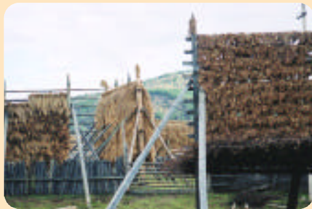
晒青稞是「香格里拉」最主要農作物。

玉龍雪山的峽谷，因地形險峻又有落差，水流速度加快，且江中礁石密佈，水嘯聲震耳欲聾；傳說有老虎借江中巨石為跳板，一躍過江，而將此地稱之「虎跳峽」，古人有詩為證：「玉壁千年存古雪，金沙萬里走波瀾」，形容金沙江的水流，穿越一座神秘雪山的奇景。