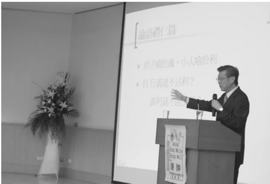
陳冲董事長期許企業有「小義大利」的經營理念

中華民國產物核保學會今年的會員大會，邀請前財政部次長、現任中信證券公司董事長陳冲，就其金融及保險的專業領域之外，有關企業應有的社會責任，發表專題演講；以下陳冲董事長的演講內容，摘要如下：