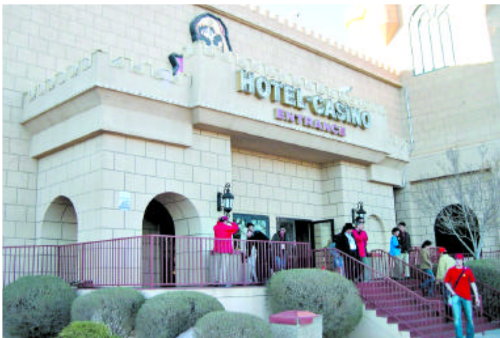
每一旅館均以設計舒適及豪華的賭場，吸引客戶上門。

空，搭配金黃色的陽光，照射在白茫茫的雪地上，在如此優美的時空環境，觀賞世界七大自然奇景之一的大峽谷，那可是老天爺賞賜才可能有的機會。