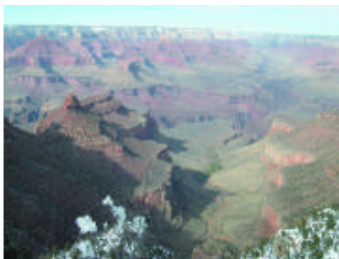
由南緣眺望北緣，中間的山谷即是科羅拉多河經年累月沖刷的結果。