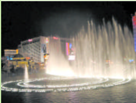
水舞表演是結合燈光，音效、音樂及噴水，相互搭配的演出。