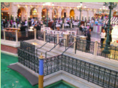
義大利威尼斯皇宮廣場的場景，出現在美國拉斯維加斯的旅館酒店。