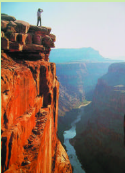
垂直的峭壁是大峽谷的景觀特色，高低落差達1600公尺。