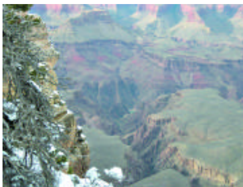
谷底就是科羅拉多河，有看到嗎？

貌，不僅是全球最豪華的旅館飯店、或規模最大的賭場，由室外建築的造型、燈光、電腦重動畫、及水舞表演、霓虹燈，將拉斯維加斯妝扮的更閃亮耀眼。