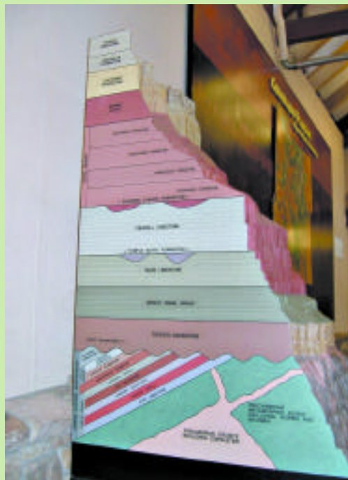
大峽谷的岩石結構。可分為十二個層次