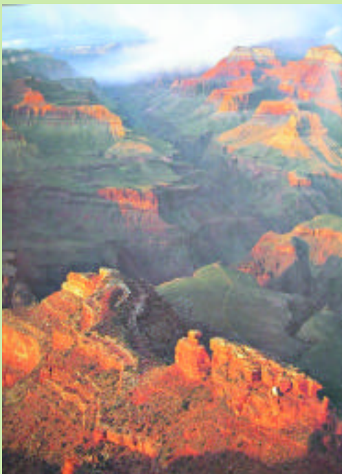
大峽谷的奇岩怪石，居高臨下，可感受其雄偉的氣勢。

拉斯維加斯屬於內華達州，跨越科羅拉多河，進入亞歷桑那州，即是大峽谷國家公園（Grand Canyon National Park）的所在地，該公園是一九一九年成立，較世界第一座國家公園「黃石公園」晚了四十七年；而大峽谷公園的面積為四九三一平方公里，只有