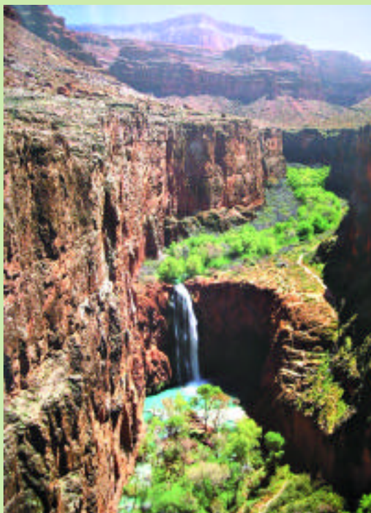
大峽谷有綠意盎然，流水瀑布的美麗景色。